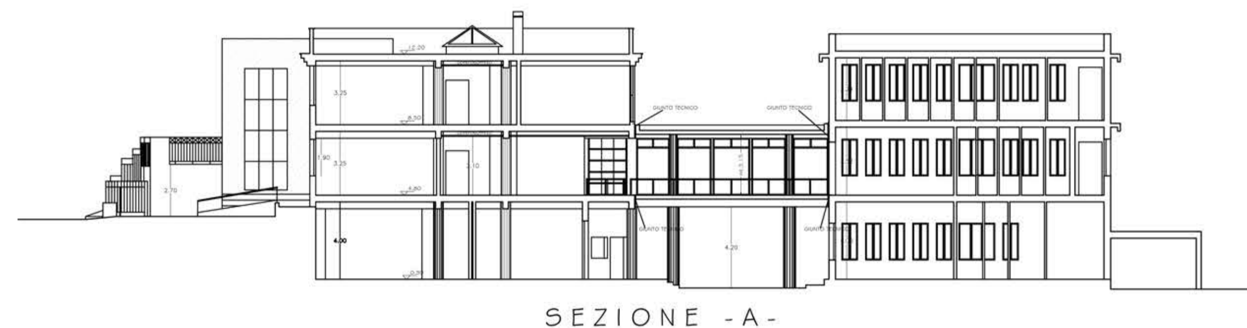
SEZIONE - A -