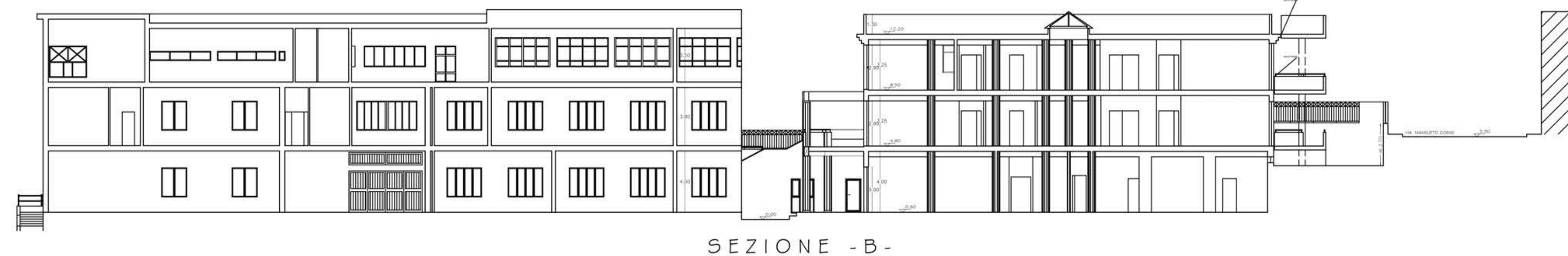
SEZIONE - B -